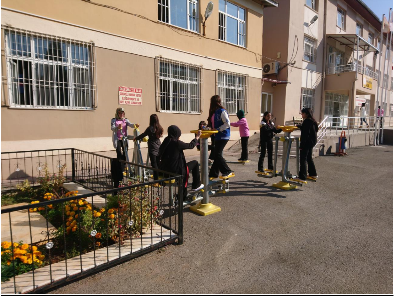
Resim 2 : Nevruz Kutlama Etkinliğinden