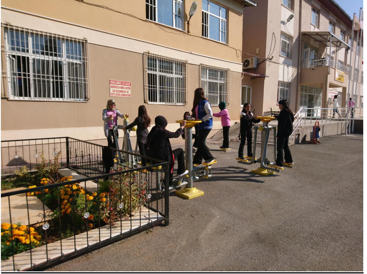
Resim 2 : Nevruz Kutlama Etkinliğinden