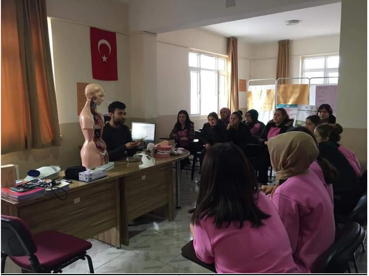
Resim 11: Çocuk Gelişimi Atölyesinde Ders İşleyen Öğrencilerimizden